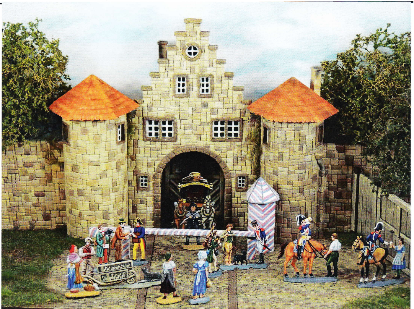
An der Wache

Jahresbrief 2016 der Zinnfigurenfreunde Koblenz e.V. ISSN 2364-1290